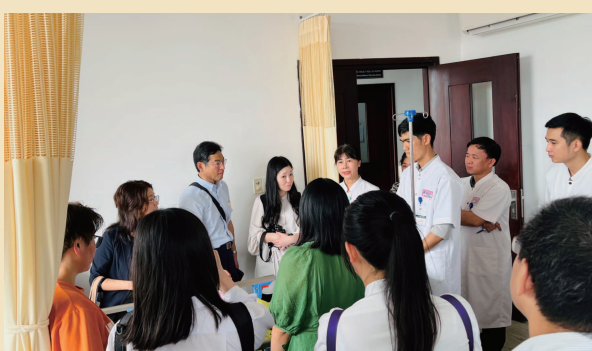
▲フエ中央病院での現地の介護現場を見学

短い滞在ではありましたが、到着時には不安げだった生徒の皆さまが、最終日には自ら質問し、覚えたベトナム語を使って、「もっとベトナムを知りたい」「帰りたくない」と話されていた姿が、とても印象に残っています。