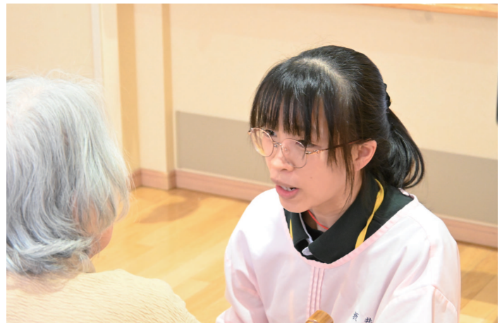
声掛けをしながら利用者に寄り添うチンさん

今後も「日本式(まるめろ式)介護」のケアとおもてなしの心を海外へ広げ、日本と海外、双方の未来をつないでいきます。