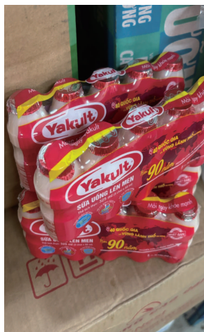
▲あの有名なヤクルトも常温です。

この出来事を通して、「当たり前」は国によって全く違うのだと感じました。介護の現場においても、相手のこれまでの生活や文化、価値観を理解し、尊重することが大切だと改めて実感しています。これからはもう一人ひとりに寄り添った支援につなげていきたいと思えます。