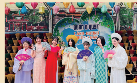
▲アオザイ姿で現地文化を体験

到着された皆さまの表情には、長時間の移動による疲れとともに、初めての海外研修に対する緊張も見られました。アオザイ選びでは、現地のにぎやかな雰囲気に対し戸惑う様子もありましたが、それぞれが自分に合う色やデザインを選ぶうちに、少しずつ笑顔が増えていきました。