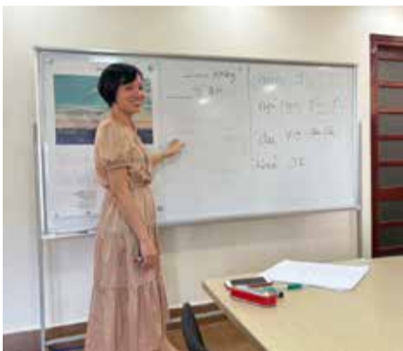
毎日ベトナム語学習をしています