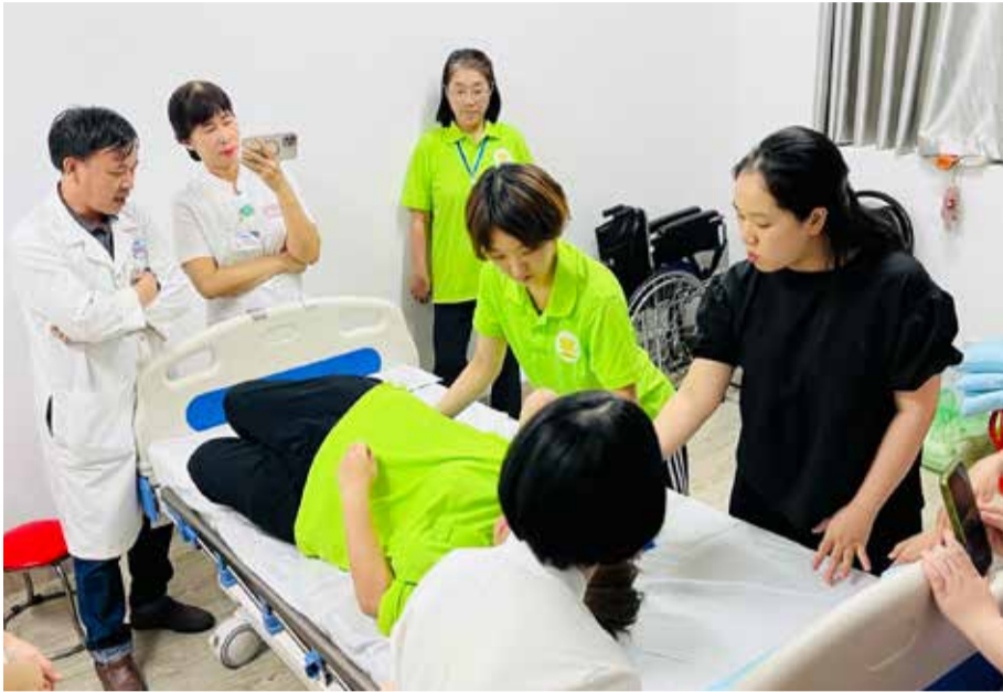
病院での介護導入研修の様子

ベトナムには「介護」という考え方や言葉が無いと言われてきました。一方で、自宅で家族が高齢者のお世話をするというのは、日常の中にあることもわかってきました。しかしな