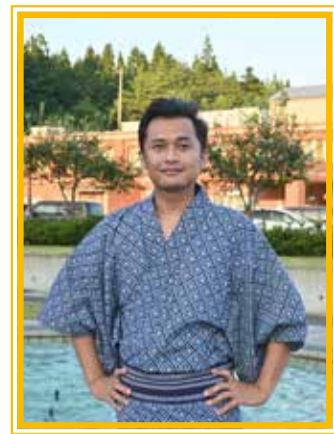
出身地 インドネシア スマトラ島ノバダン (ジャカルタから飛行機で1時間半)