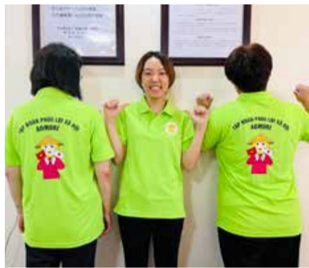
めろめろちゃんも一緒にベトナム入り

がら、私たちのパートナーである病院の先生方やナースも、介護という言葉はわかるけれども、実態はまだ見えていないというのが現状です。