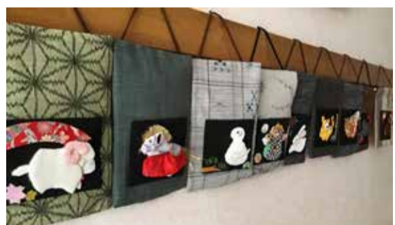
壁一面に飾られたタペストリー