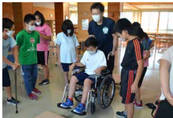
段差を介助するときは「登りは前進、下りは後ろ向き」です。

「福祉の仕事ってなんだろ?」「介護の仕事って何をしているの?」など、自身の経験を踏まえながら、講義を行いました。 講義のあとは「高齢者疑似体験セット」を装着し、高齢者の身体的機能の低下や心理を体験したり、車いすの基本的な操作方法について体験しました。