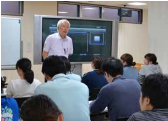
映像を交えた講義で、考える力を養います。

職員向け奨学金「みちのく荘職員スキルアップ奨学金」とは? 職員の自己啓発による、スキルアップ等を図るための奨学金制度です。法人内部研修の「未来塾」と「寺子屋」に参加し、レポートを提出することで最高15万円の奨学金の貸与を受けることができます。 ※規定の出席回数を満たしていることが必要です。 返還は、奨学金を貸与された時点から、2年間を当法人で勤務することで免除されます。