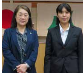
今後も安心して働ける職場環境づくりに、積極的に取り組みます。

職員向け奨学金「みちのく荘職員スキルアップ奨学金」とは? 職員の自己啓発による、スキルアップ等を図るための奨学金制度です。法人内部研修の「未来塾」と「寺子屋」に参加し、レポートを提出することで最高15万円の奨学金の貸与を受けることができます。 ※規定の出席回数を満たしていることが必要です。 返還は、奨学金を貸与された時点から、2年間を当法人で勤務することで免除されます。