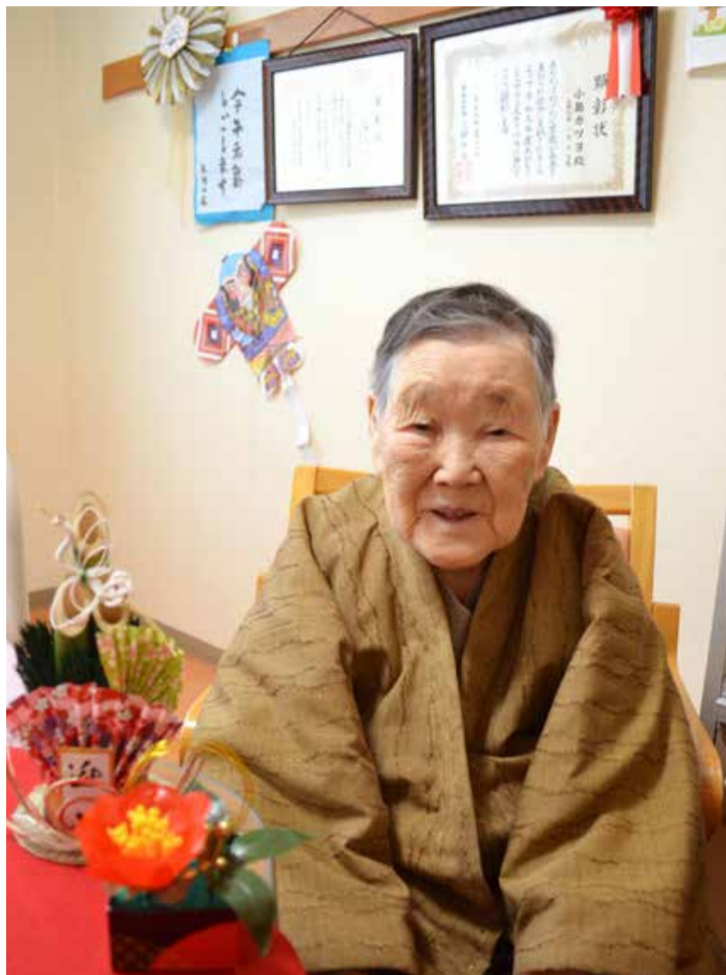
季節の行事がたくさんある、ここでの毎日は笑顔が絶えません。