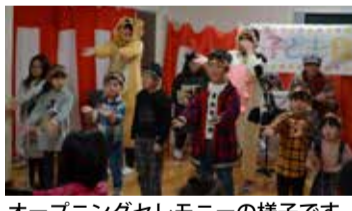
オープニングセレモニーの様子です。

詳しくはみちのく荘のウェブサイト www.michinokuso.jp を、ご覧ください!