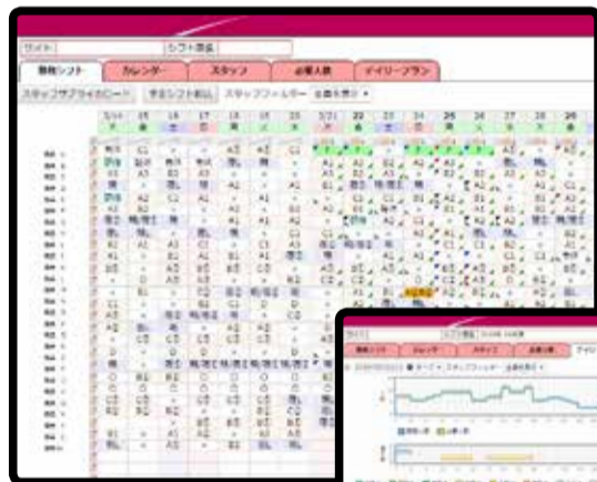
▲「びっくりシフトさん」で作ったシフト完成画面例。▶

現在、当法人では特養施設で運用していますが、法人全事業所への展開を進めていく予定です。