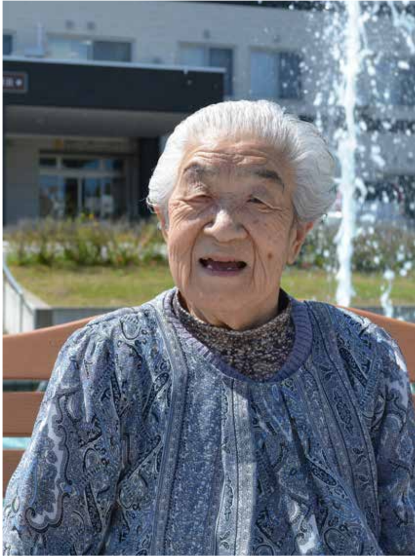
仲間や職員と歌ったり踊りながら、笑顔で暮らしています。

ここにいれば何の不安もなく笑っていられる。 笑顔で過ごせる、今を大切にしていきたい。