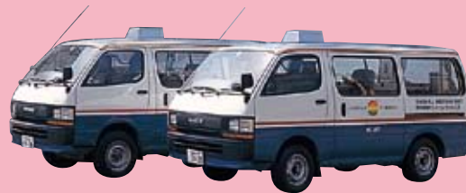
訪問入浴サービスカー