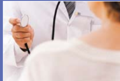
訪問診療が地域の安心を支えます