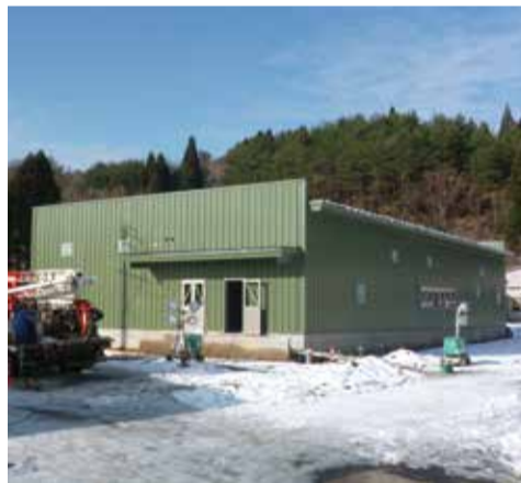
今年の春の完成を目指しています。

真空調理工場 みちのく城ヶ沢フードセンター 建設工事進行中!! 現在、むつ市城ヶ沢地区にて、真空調理工場「みちのく城ヶ沢フードセンター」の建設工事が着々と進行中です。 真空調理の特徴に、HACCP(総合衛生管理製造)による衛生管理があります。HACCPは、1960年代にアメリカで宇宙食の安全を確保するために開発された食品の衛生管理の方式です。徹底した衛生管理によって食中毒を防止し、皆さんに安全な食の提供をしたいと考えています。 また当法人では、むつ市内に住む一人暮らしの高齢者や65歳以上のみの世帯の方を対象に、お弁当の宅配サービスを行っています。みちのく城ヶ沢フードセンターのオープン後は、この場所を中心に、更に宅配地域を拡大する計画を立てています。