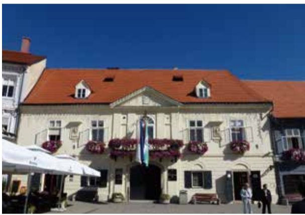
ザグレブはクロアチア最大の都市で中央政府や行政機関の拠点地。

主に「クロアチアの福祉制度の現状について」話された。 まず、クロアチアにおける社会福祉は1990年後半から始まり社会福祉政策省が担っている。制度は州毎に異なり、社会福祉や医療は未だ安定しているとは言えない。 クロアチアの福祉の特徴は、第一次世界大戦から始まる長い戦争による犠牲者、中でも退役軍人や戦争の後遺症による人々を対象するものであり、 ①虐待 ②経済的困窮 ③家庭崩壊による子どもの養育や離婚問題 ④自分の価値を見いだせない人々の問題等山積している。 また、社会主義から資本主義への激変に付いて行けない人々の姿も見える。 来年、社会福祉を改革する法律が制定され、未だ実施されていない各種の訪問ケアが可能となる。しかし、クロアチアでは、コンピュータネットワークが未整備であり負担(税金)と給付のあり方について、いかに公平さを保てるか懸念する事もある。