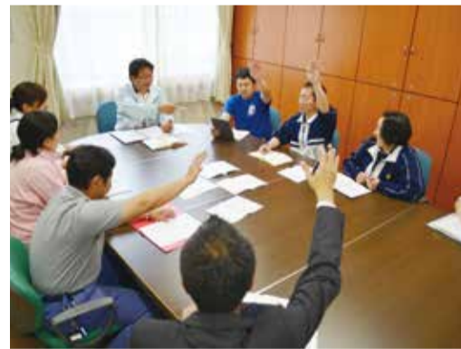
議会のテーマは職員ひとりひとりからの声。アンケートで職員からの意見を募り、議論されます。

議会は、年4回の定期開催の他、緊急議案発生時には議長が招集するなど、一般市議会のように運営規定を設け、実施されることとなります。