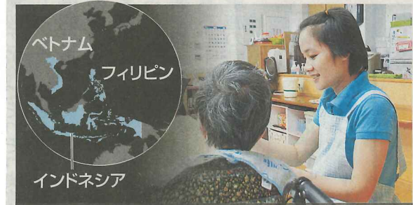
ベトナム フィリピン インドネシア EPA制度で来日し、特別養護老人ホームで働くベトナム人 介護固有の要件も 検討中

途上国への技能や知識の移転を目的に1993 年にできた。現在は機械、繊維、建設関係な ど74職種で約21万人を受け入れている。安価 な臨時労働者として扱われるため国際社会か ら「強制労働」との非難が高まり、今国会で制 度の適正化を進め、併せて介護を職種に加え る関連法が成立。来年11月までに施行される。