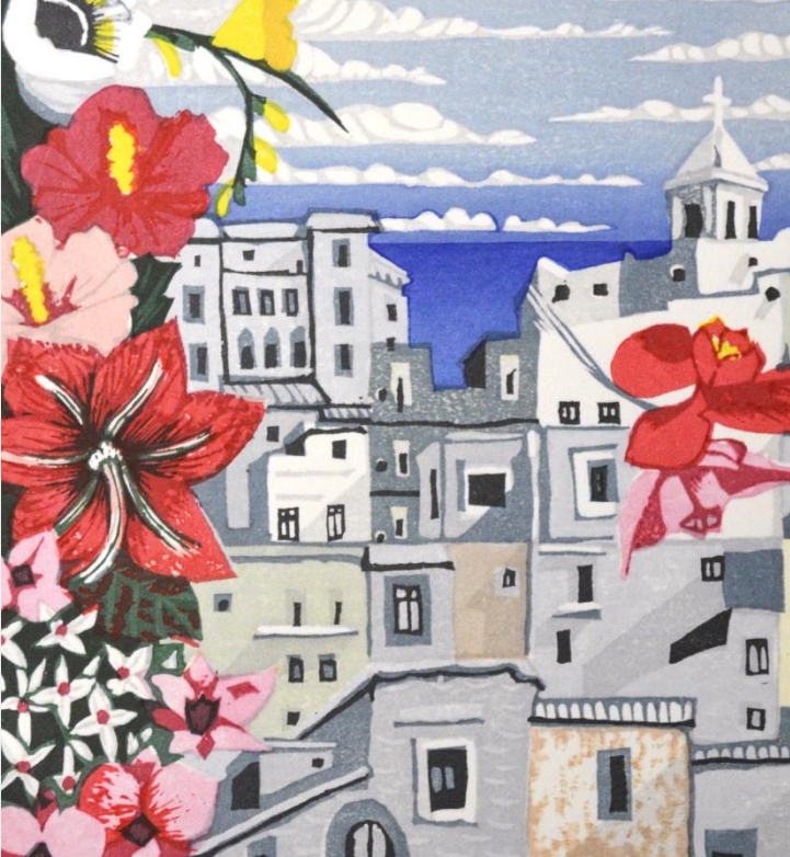
上：花物語【九月 曼珠沙華】／1970年 下：花物語【七月 ヒヤシンス】／1971年